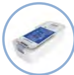
Inogen One ® G5 Batería de Litio ION de larga duración** Hasta 13 hrs. de uso continuo Item #BA-516