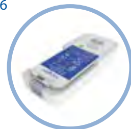
Inogen One G5 Batería de Litio* Hasta 6.5 hrs. de uso continuo Item #BA-500