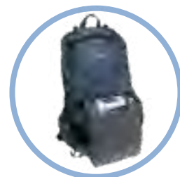
Inogen One G5 Mochila** Item #CA-550