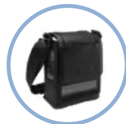
Inogen One G5 Bolsa de transporte* Item #CA-500