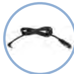
Inogen One G5 Cable DC para auto* Item #BA-306